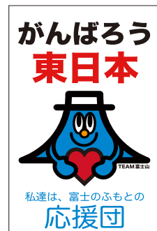
【ポスターイメージ】 B2サイズ…100部 A4サイズ…200部